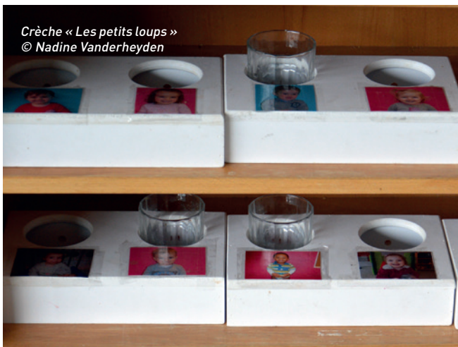
Crèche « Les petits loups »

Toujours dans l'optique de favoriser l'autonomie des enfants, la responsable a imaginé des porte-verres et leur support sur mesure. Un ouvrier de la commune (PO) les a réalisés en bois.