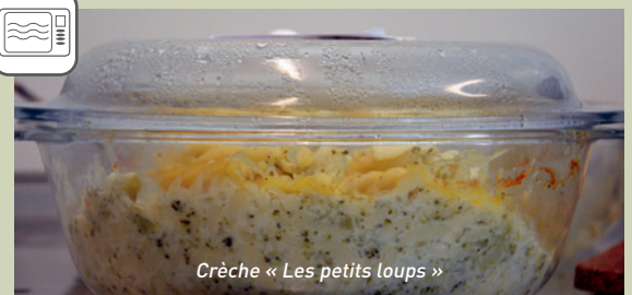
Crèche « Les petits loups »

■ Le film plastique peut également contenir du BPA ou d'autres agents plastifiants nocifs. Ceux-ci vont migrer dans les aliments en contact avec des matières grasses.