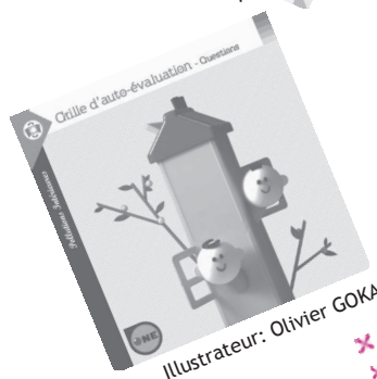
Illustrateur: Olivier GOKA