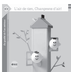
Illustrateur: Olivier GOKA

Le coffret se compose de différents outils, qui abordent la question de l'environnement intérieur de manière pragmatique et variée sous différents supports papiers. Les liens entre les outils permettent d'entrer petit à petit dans la matière en fonction du rythme et des besoins de chacun.