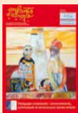
Enfants d'Europe N°18 : Pédagogie contextuelle