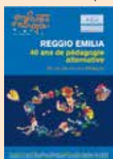
Enfants d'Europe N°6 : REGGIO EMILIA - 40 ans de pédagogie alternative