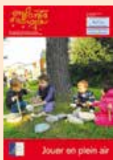
Enfants d'Europe N°19 : Jouer en plein air