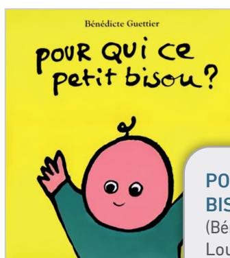
POUR QUI CE PETIT BISOU ? (Bénédicte GUETTER, Loulou & Cie, L'école des loisirs)

Les mots des albums créés par Bénédicte GUETTER touchent au plus juste les petites oreilles, ils sont sélectionnés minutieusement, rien n'est laissé au hasard. Alors pourquoi ne pas plonger dans ce « livre-puzzle » qui explique délicieusement ce que vous êtes susceptible de trouver dans les ventres de nos animaux familiers ou presque. Si le ventre de la vache accueille des pâquerettes, des boutons d'or et plein d'herbes tendres, celui du cochon surprendra tout le monde, en y trouvant une chaussure gauche. Et le ventre du loup ? Il entamera une joyeuse visite des contes traditionnels, une mise en bouche apéritive à la portée des petites oreilles. Et quand la lecture est terminée, il reste à faire le puzzle... un autre moment de plaisir.