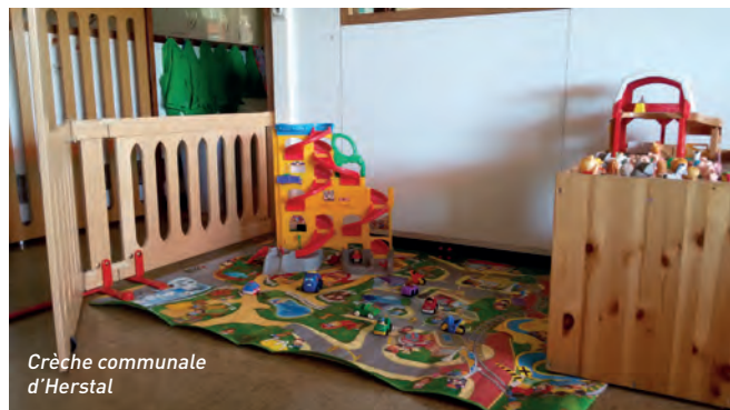
Crèche communale d'Herstal