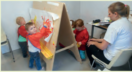
« Une salle polyvalente aménagée pour les activités spécifiques :