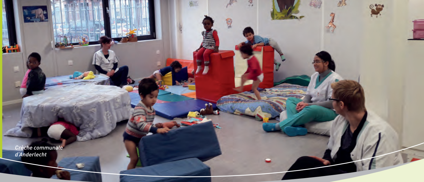
Crèche communale d'Anderlecht