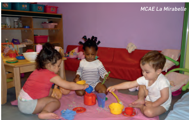
MCAE La Mirabelle